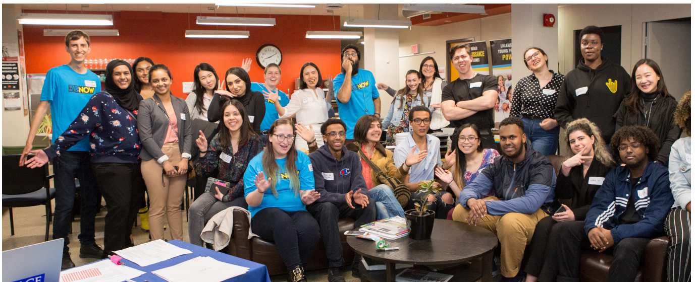
OUR FIRST NETWORKING EVENT AT 250NE COMMUNITY

In March 2019, YAN sponsored the participation of five delegates to the Progress Summit , organized by the Broadbent Centre, creating an opportunity for local youth leaders to link with and learn from 1200 thought leaders, movement builders, elected officials and young activists from across Canada and around the world. Through expert panels, workshops and informal discussion, the sponsored delegates deepened their knowledge, developed their networks and built their confidence as changemakers.