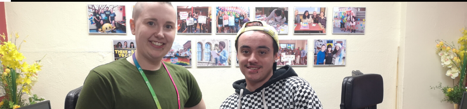
RAIDEN AND GUNTHER OF SPECTRUM YOUTH